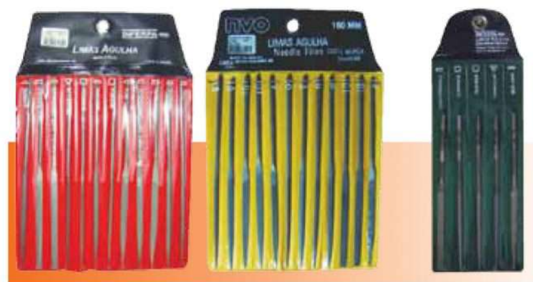
Completo c/ 12 pçs Bastarda